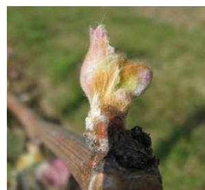
Eclatement du bourgeon (D-06)