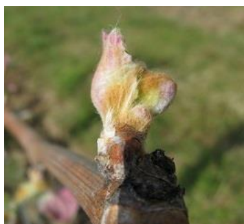
Stade D06- Eclatement du bourgeon

Stades de forte sensibilité à observer sur les 2 premiers bourgeons de la base :