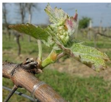
Stade E 09- 2 à 3 feuilles étalées