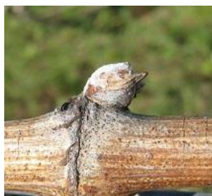
Bourgeon dans le coton (B-03)

En revanche, il peut être observé, sur certaines parcelles (fonction du diamètre des sarments, des cépages,...) et sur des secteurs plus précoces, un stade plus avancé avec présence, parfois, de 1 à 2 feuilles étalées, en bout de latte.