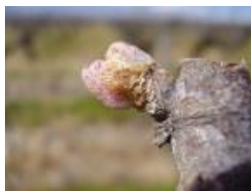
Pointe verte (C-05)