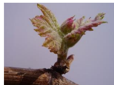
1 feuille étalée (E-07)