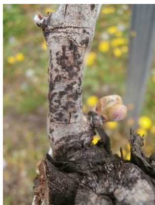
Symptômes d'excoriose discrets mais étranglement à la base du rameau

Il est important d'évaluer sur votre vignoble le niveau d'attaque sur les bois laissés à la taille. L'opération consiste à compter les bois laissés à la taille (astes et cots) présentant des symptômes (cf. photo des symptômes). Réaliser un comptage sur 50 ceps. Les symptômes sont situés à la base des rameaux (en général sur les 3 premiers entre-nœuds) sous forme de nécroses brunâtres peu profondes, en forme de fuseau et de lésions étendues d'aspect ligneux ou de blanchiment des rameaux avec des ponctuations noires (pycnides).