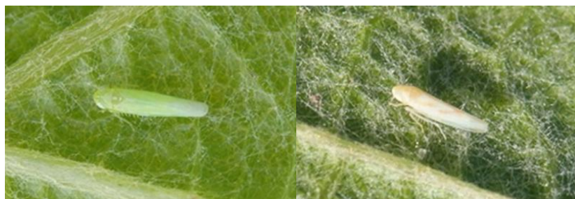
Cicadelle verte adulte et Cicadelle italienne adulte

Les premiers adultes sont observés au vignoble depuis la semaine dernière. A ne pas confondre avec la cicadelle italienne (Cf. photo ci-dessous).