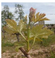
E10-4 feuilles étalées