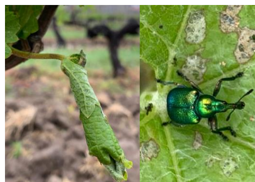
Cigare - Insecte

Le seul moyen efficace est d'éliminer les cigares en les ramassant, lors de vos épamprages ou ébourgeonnage, et en les mettant dans une poche que vous brûlerez.