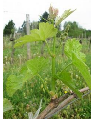
F12-5 à 6 feuilles étalées- grappes visibles