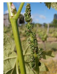
G15- Boutons agglomérés