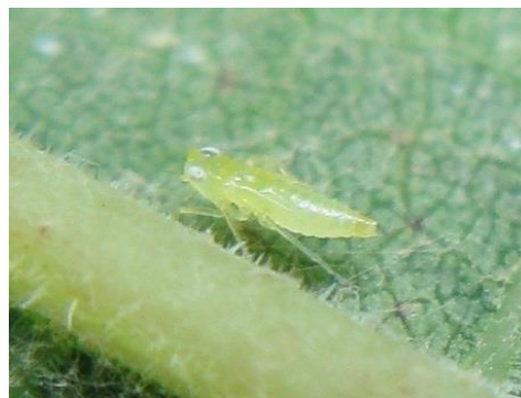
Larve de cicadelle verte ( Empoasca vitis )