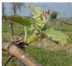
E09-2 à 3 feuilles étalées

De plus, nous observons toujours, sur les secteurs plus précoces, un stade plus avancé soit « G15 - Boutons agglomérés ».