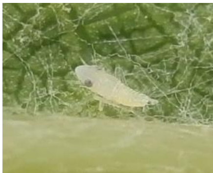
Larve de cicadelle de la Flavescence dorée ( Scaphoïdeus titanus )

Cette cicadelle a pour principale caractéristique morphologique distinctive la présence de 2 taches noires sur l'extrémité de l'abdomen observables à tous les stades larvaires. Les larves mesurent de 1,5 à 5,5 mm, elles sont blanches à brunes avec l'âge et sont très vives (elles sautent dès qu'elles sont dérangées). Les adultes mesurent 5 à 6,5 mm et sont de couleur brune ocre.