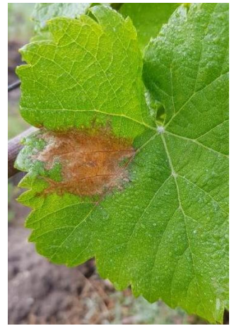
Tache de Botrytis

Les attaques de Botrytis sur feuilles sont fréquentes au printemps. Elles ne présentent aucun risque pour la vigne et ne présagent pas de futures attaques sur grappes.