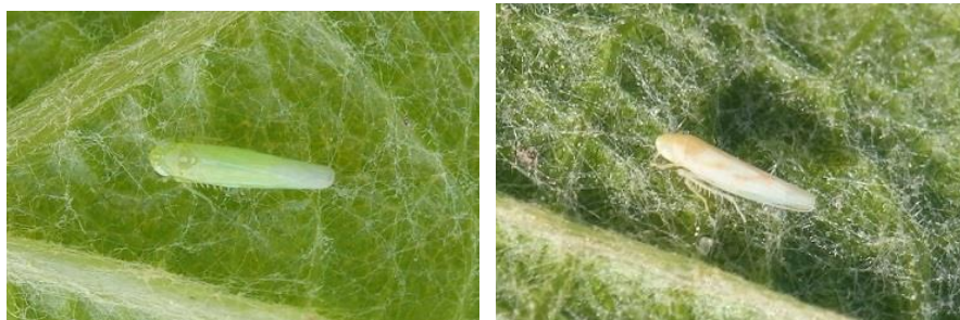
Cicadelle verte adulte et Cicadelle italienne adulte

Des adultes sont toujours signalés au vignoble. Pour rappel, à ne pas confondre ces derniers avec la cicadelle italienne (cf. photo ci-dessous).