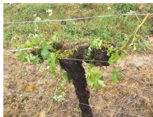
Dégâts de grêle à St Ferme