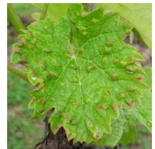
Symptôme d'Erinose

Favoriser les populations de Typhlodromes.