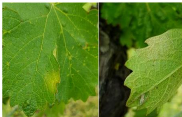
Tache de Mildiou (face supérieure) légèrement sporulante (face inférieure)

Hors réseau BSV, depuis jeudi dernier, quelques nouvelles sorties de taches ont été signalées sur le secteur centre Médoc (source viticulteurs). De plus, 2 taches fraîches isolées nous ont été remontées sur le secteur Lot-et-Garonne (Cocumont, source Cave du Marmandais). Et depuis ce début de semaine, une tache a été détectée sur le secteur Libournais (feuille située sur le rang 4 du rameau - source DA Conseil, cf. photo ci-contre ), sur l'entre-deux-mers (source Soufflet Vigne) et le secteur Pays Foyens (sur pampres - source CA33).