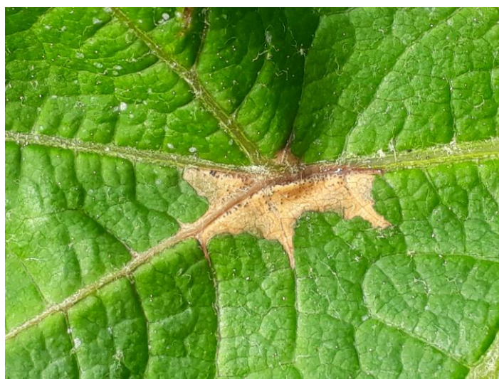
Tache de Black avec pycnides

A noter que sur notre réseau BSV, il y a 2 Témoins non traités situés sur des secteurs précoces du Libournais qui présentent 10% des ceps avec une tache (Source GDON du Libournais). Il a été également observé sur une parcelle de référence située dans l'Entre-deux-mers, 9% des ceps avec une tache (source SRA Cadillac).